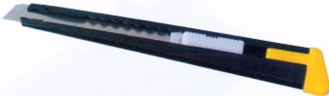
Cutter in blister con 2 lame ricambio NIJI 180