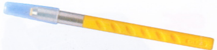
Cutter in blister ART-KNIFE NIJI