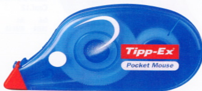
Correttore a nastro Tipp-Ex Pocket Mouse

Ideale per la scuola, la casa, l'ufficio. 4,2mm x 9mt.